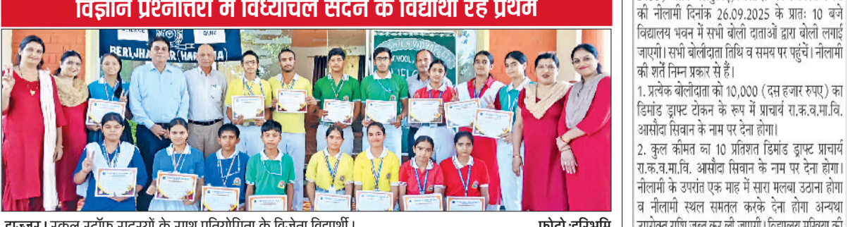
झज्जर। स्कूल स्टाफ सदस्यों के साथ प्रतियोगिता के विजेता विद्यार्थी।