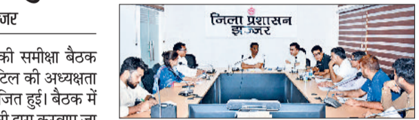
मुक्त करने के लिए विशेष अभियान चलाया जाए। उन्होंने चेतावनी दी कि 15 दिनों के बाद यदि किसी सड़क मार्ग पर सीएंडडी वेस्ट मिलता है तो संबंधित क्षेत्र के जेई की जिम्मेदारी तय की जाएगी।

डीसी ने कहा कि इस अभियान में किसी भी स्तर पर लापरवाही या असंवेदनशीलता बर्दाश्त नहीं की जाएगी। उन्होंने कहा कि शहर की सड़कों को सीएंडडी वेस्ट