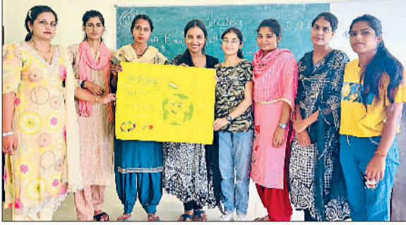
झज्जर। हिंदी भाषा की महत्ता पर बनाए पोस्टर के साथ छात्राएं।