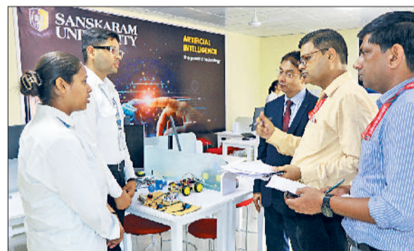
झज्जर। विद्यार्थियों द्वारा बनाए गए प्रोजेक्ट्स व मॉडल का अवलोकन करते हुए अतिथि।