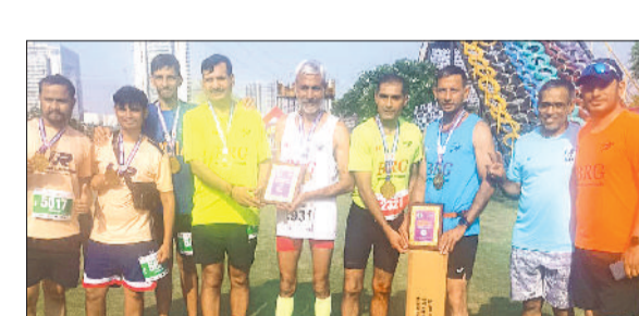
बहादुरगढ़। हाफ मैराथन में दौड़ने के बाद बीआरजी के धावक।