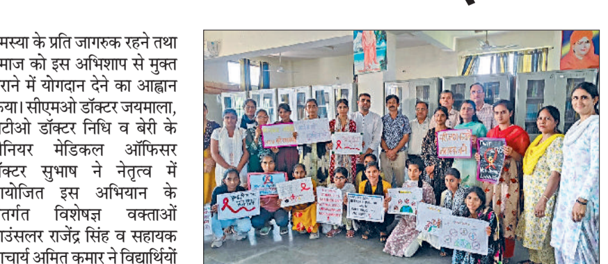
झज्जर। प्रतियोगिता के विजेता विद्यार्थियों के साथ स्वास्थ्यकर्मी एवं शिक्षक।