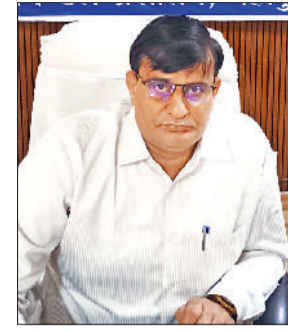
को आवश्यक दिशा-निर्देश दिए।