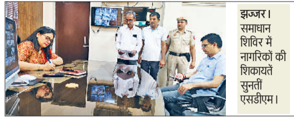
झज्जर। समाधान शिविर में नागरिकों की शिकायतें सुनीं आई एसडीएम।

कुल 15 शिकायतें दर्ज हुईं। जिनके समाधान के लिए अधिकारियों को निर्देश दिए गए। उपायुक्त ने अधिकारियों को निर्देश दिए कि शिकायतों का समाधान तय समय-सीमा में किया जाए।