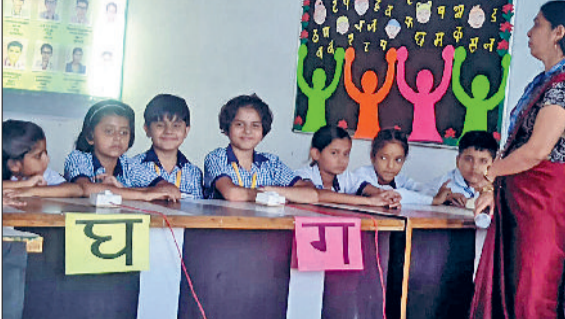
झज्जर। प्रतियोगिता में भागीदारी करते हुए आरईडी स्कूल के विद्यार्थी।