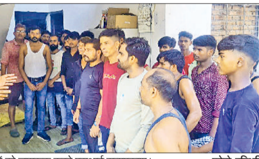
बहादुरगढ़। लोगों को जागरूक करते एनएसएस प्रयास।

सभी को सहयोग करना होगा, ताकि समाज को नशामुक्त बनाया जा सके। इस अवसर पर नशा मुक्ति टीम के उपनिरीक्षक वीरेंद्र ने भी युवाओं से आत्मीय संवाद कर उन्हें शिक्षा व