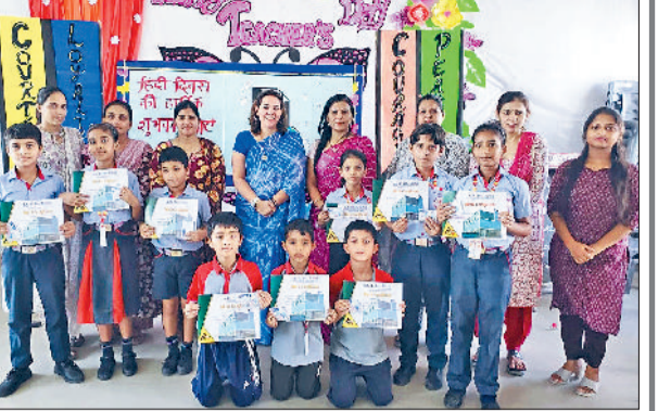
झज्जर। शिक्षकों के साथ उपस्थित विजय के विजेता विद्यार्थी।