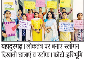
बहादुरगढ़। लोकतंत्र पर बनाए स्लोगन दिखाती छात्राएं व स्टाफ।